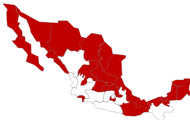
Mapa de Cobertura 2021:

Baja California, Baja California Sur, Campeche, Chiapas, Chihuahua, Coahuila, Colima, Guanajuato, Hidalgo, Morelos, Nayarit, Nuevo León, Oaxaca, Querétaro, Quintana Roo, San